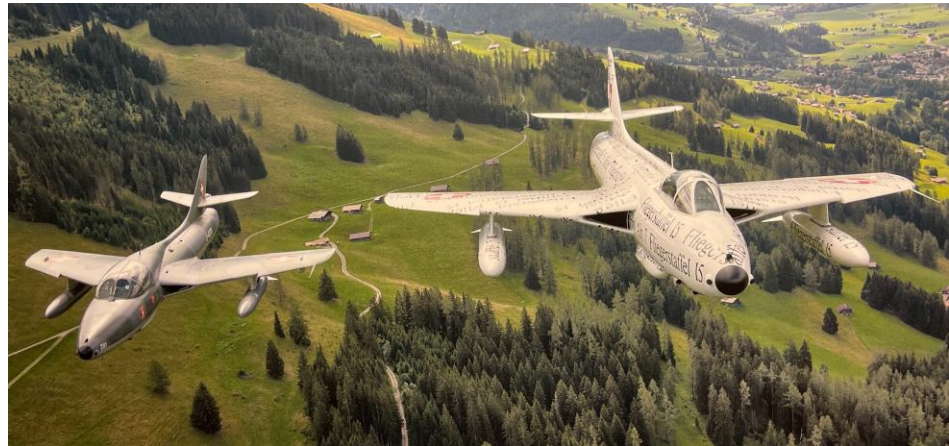
Münsingen im Januar 2025